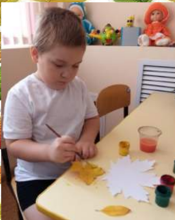
Нанесение краски на лист