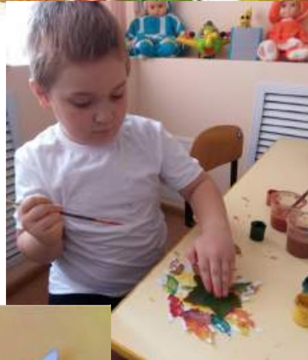
Раскрашивание отпечатками листа